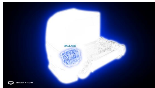
QUANTRON QHM FCEV & BALLARD Brennstoffzelle