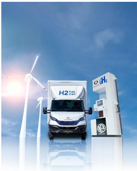
QUANTRON – NEUMAN & ESSER POWER STATION