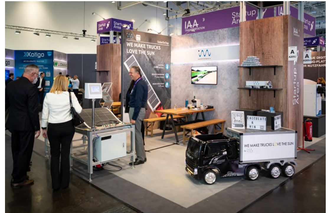
*Bild dient als Referenz und kann vom tatsächlichen Produkt abweichen.