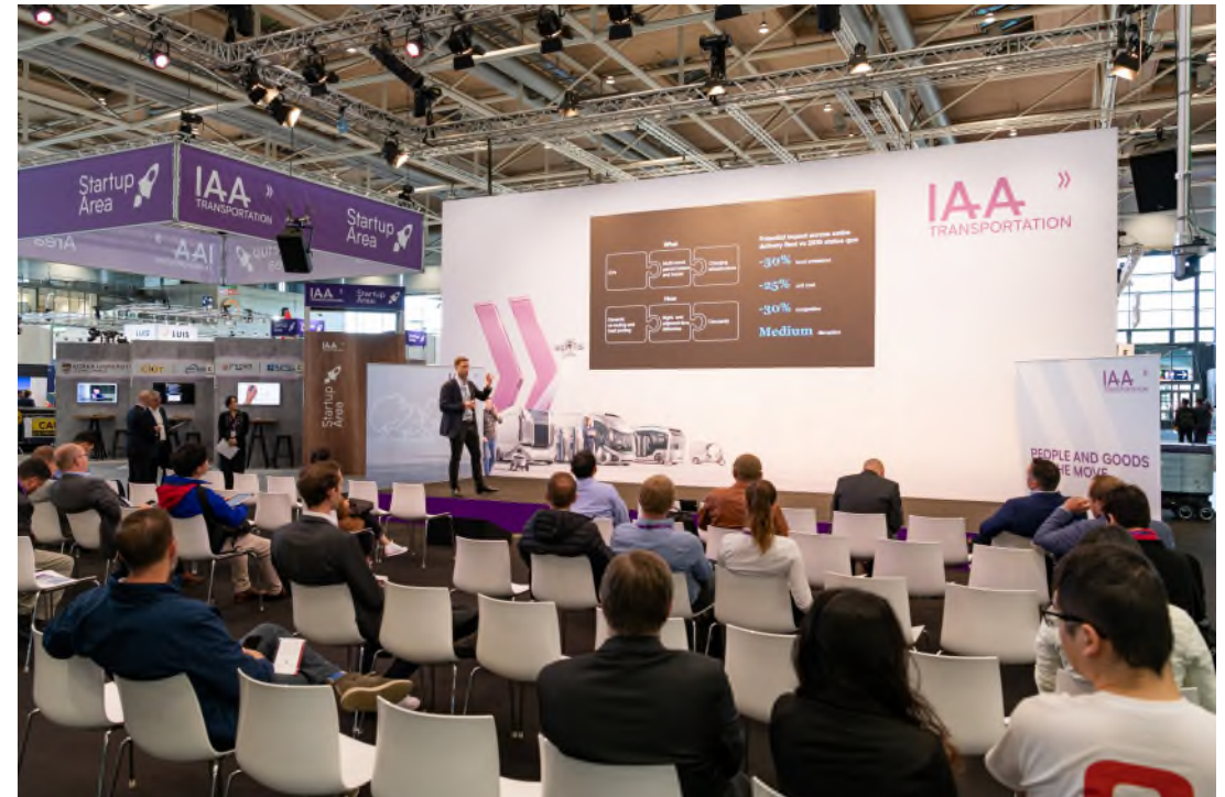
*Bild dient als Referenz und kann vom tatsächlichen Produkt abweichen.